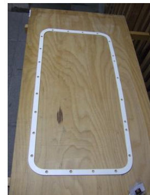
El marco FOREX terminado

Los imanes quedan insertos al ras en el marco FOREX y ya no se pueden caer.