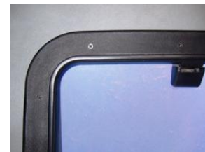
Techo solar sin mosquitera

Finalmente, la mosquitera terminada se puede fijar muy fácilmente al marco del techo solar, ya que se centra por sí misma gracias a los imanes. E igual de sencillo es quitarla, p. ej., para cerrar el techo. Funciona de maravilla :-)