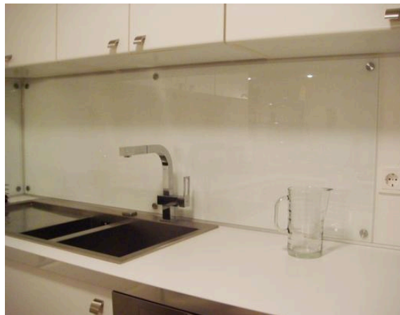
La protección, aún sin elementos decorativos